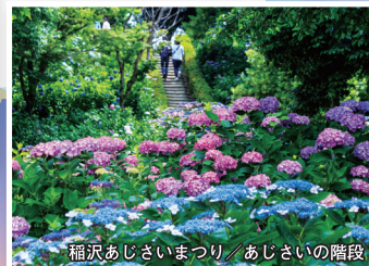
稲沢あじさいまつり / あじさいの階段