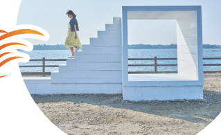
佐久島 / イーストハウス